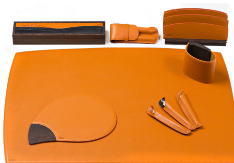
Trophée de l'accessoire ENSEMBLE DE BUREAU - SUNSET