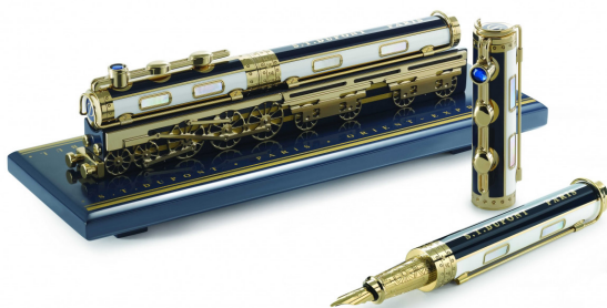
Trophée de la Série Limitée S.T.DUPONT / ORIENT EXPRESS